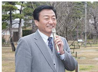
大西秀人高松市長