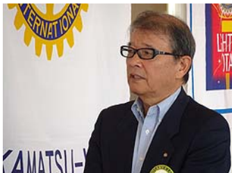
野口会長報告・会長卓話