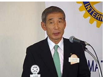
玉越様・高松中央RC30周年御案内