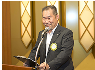
ニコニコ報告・100万突破です