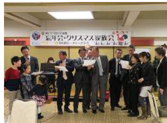
クリスマス忘年家族会