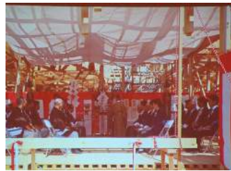
島谷R情報副委員長より