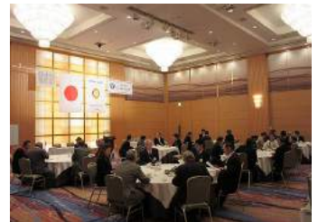
ロータリー理解について