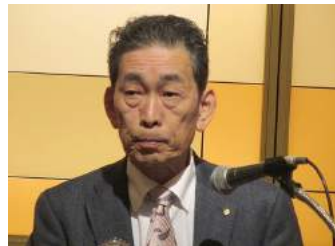
島谷R情報副委員長