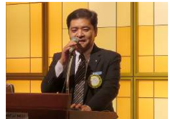
石井会員/野球部案内