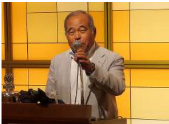
鏡原会長代行挨拶