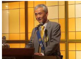
木内SAA/ニコニコ報告