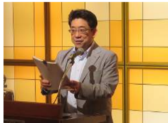
吉岡出席委員長/出席報告