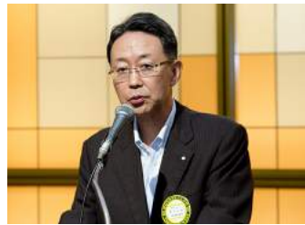
泉谷会長エレクト報告