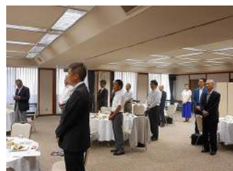
ルポール讃岐で例会