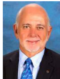
バリー・ラシン 2018-19年度 国際ロータリー会長

会長指名委員会は、2018-19 年度国際ロータリー会長に、イーストナッソー・ロータリークラブ（バハマ、ニュープロビデンス島）所属のバリー・ラシン氏を選出しました。対抗候補者がいない場合、同氏は2017年9月1日に会長エレクトとして宣言されます。