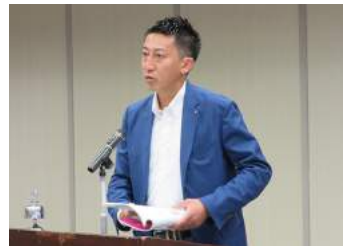
低田会員増強委員長