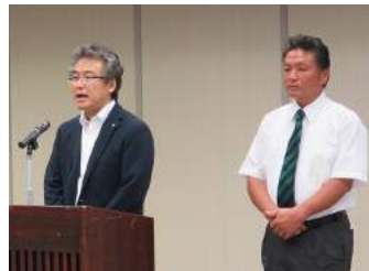
高松グリーンRC・関谷会長/福島幹事