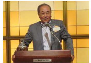
八田ガバナー補佐