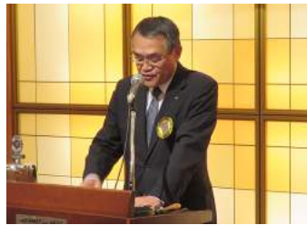
村上会長エレクト報告