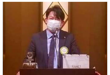
誕生日卓話:植田会員