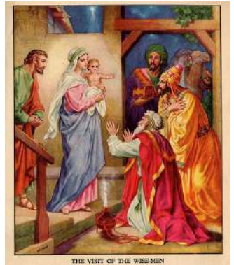
東方の3賢者の宗教画です。聖母マリアに抱かれたキリストと3人の賢者

東方の3博士がベツレヘムに到着し、キリストが公に現れた日が1月6日。キリスト教ではその日をエピファニー（日本語で公現節）と呼び、お祝いを行います。「ガレット・デ・ロワ」はその1月6日にフランスで食べられるキリスト教の宗教菓子で、アーモンド生地をパイで包んで焼き上げたシンプルなお菓子です。パイの中に陶器でできたフェーブと呼ばれるおもちゃが入っており、切り分けた際にそのフェーブが当たった人がその日の王様。紙の王冠を冠り主役となって祝宴をします。