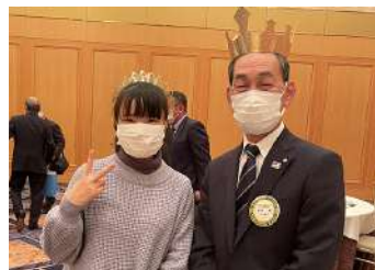
米山奨学生フェェさん・島谷会員