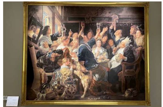
※大塚国際美術館で撮ったエピファニーを祝う人々の絵です。「豆の王様の祝宴」