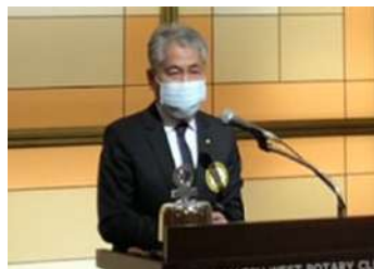
誕生日卓話「日々雑感」磯崎会員