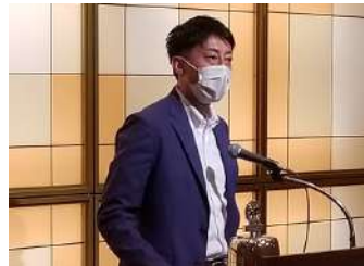
低田会長エレクト挨拶