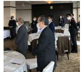
21階シエロでの例会でした