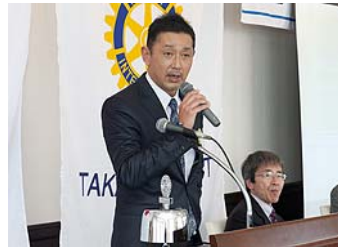
岡村会員より講師の紹介