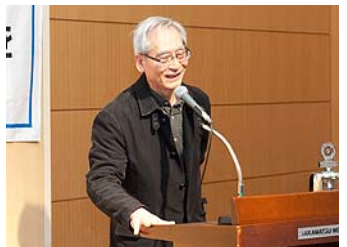
鳥養会員よりコンサートの案内