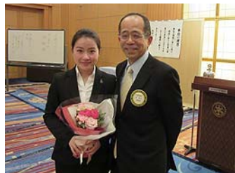
泉会員と記念写真