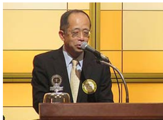
カウンセラーの泉会員から