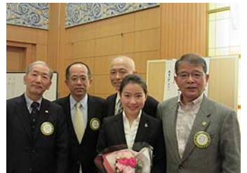
会長幹事ガバナー補佐と