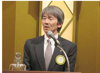
古家会長エレクト:次年度組織