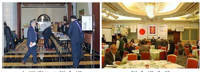
水戸南RC例会場 例会場全景