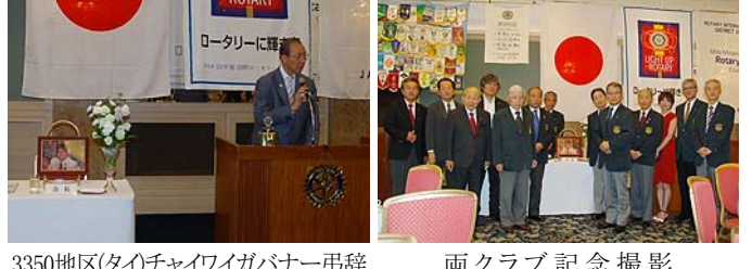
3350地区(タイ)チャイワイガバナー弔辞 両クラブ記念撮影