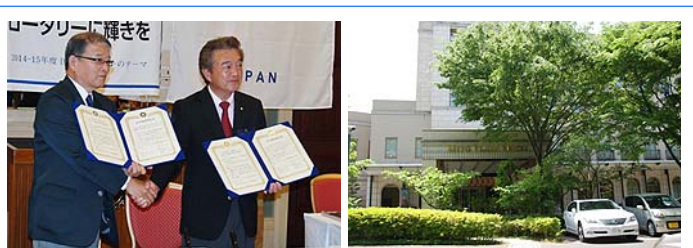
友好縁組調印書披露 水戸南RC例会場

水戸南ロータリークラブ概略 創立：1973年5月4日 例会場：水戸プラザホテル 会員数：91名（ガバナー2人輩出）