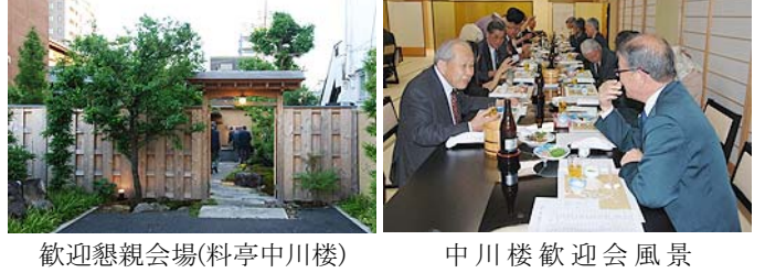
歓迎懇親会場(料亭中川楼) 中川楼歓迎会風景