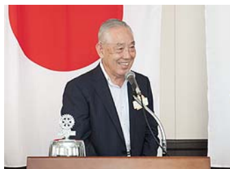
豊田パストガバナー