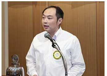
有友会員より短期交換の報告