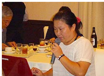
畠山様・短期交換報告