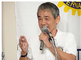
多田会員・短期交換報告