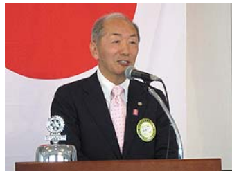
加藤ガバナー補佐