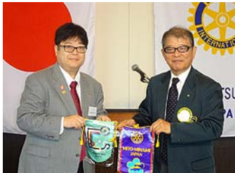
水戸南RCとパナー交換