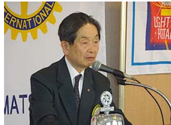
佐野委員長歓迎の言葉