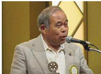
鏡原会長エレクト報告