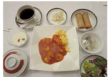
今日の昼食は中華でした