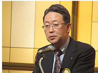
泉谷会員エレクト報告