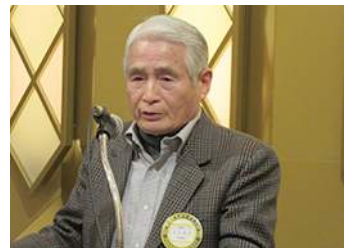
フリートーク:石川会員