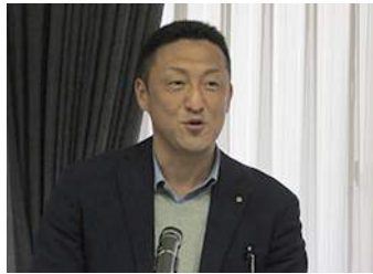
金光会員よりルポール讃岐の紹介