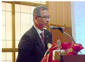
豊嶋会員退会の挨拶