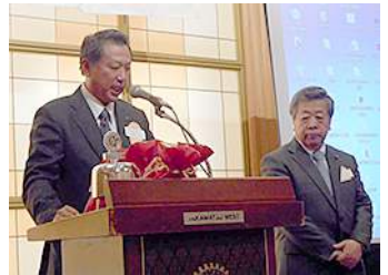
観音寺東RCよりIMのご案内