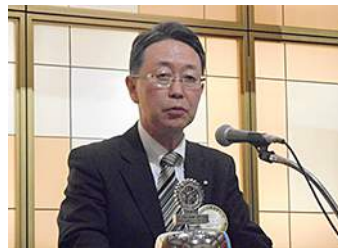
卓話: 泉谷会長エレクト