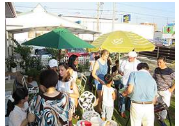
18日に短期留学生4名を囲んで夕食会を行いました