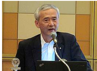
メンターデイ:「働き方改革」の話 木内会員