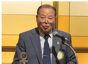
岡田米山記念奨学委員長報告