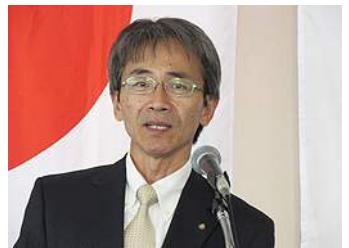
古家会員退会挨拶