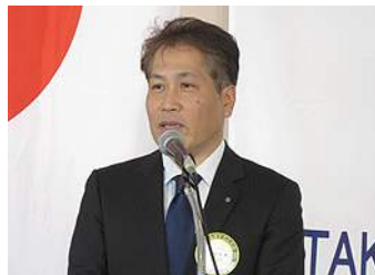
同幹事に磯崎会員