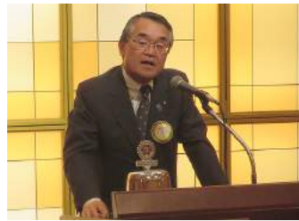
村上会長エレクトより