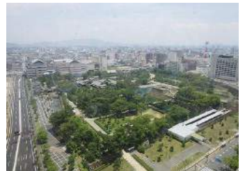
21階シエロでの例会でした