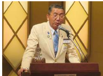
水戸南RC水越会長ご挨拶