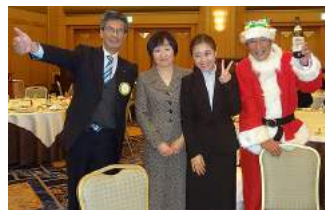
沢山の写真はfacebookをご覧ください。