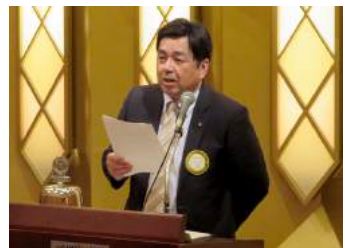
卓話:長尾出席委員長