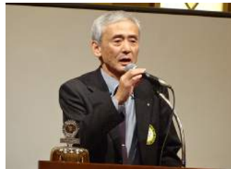
50周年記念事業 木内会員