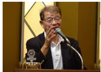
野口会員より報告