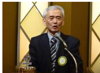
木内会員より報告