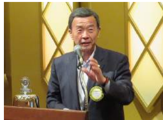
卓話「オリンピックとスポーツ少年団」住谷会員