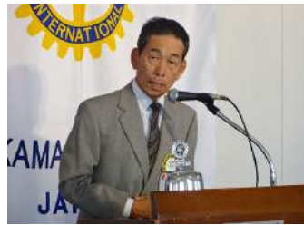
島谷会長エレクトより