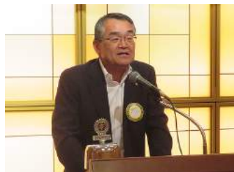
村上会長エレクト報告