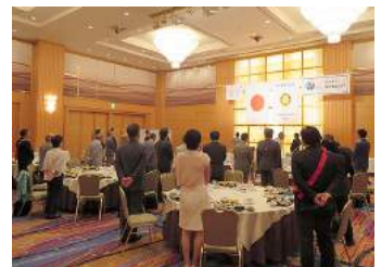
今期最終例会でした