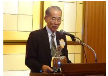
工藤ガバナー補佐講評