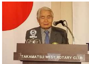
フォーラム「国際奉仕」：石川会員