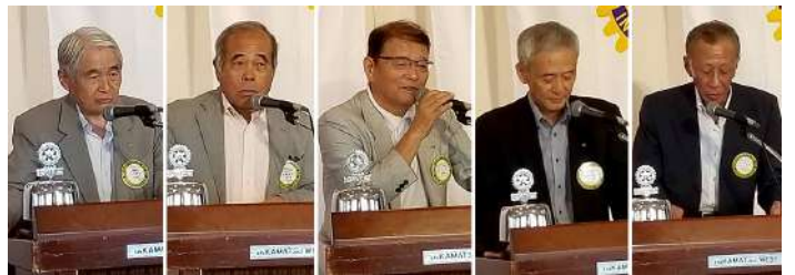
クラブ協議会・各委員長より発表