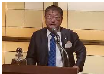
角田ガバナー補佐講評