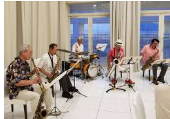
鳥養会員のバンド演奏