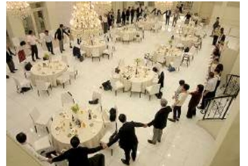
全員で「手に手つないで」